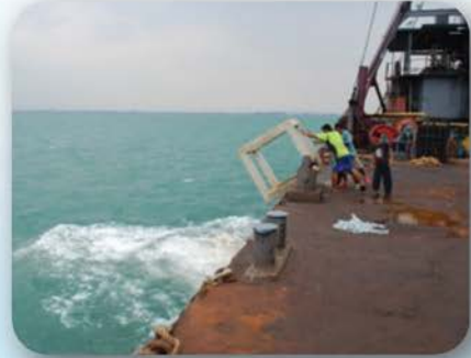
โครงการก่อสร้างปะการังเทียมชายฝั่งทะเลน้ำตื้น บริเวณอ่าวบางละมุง กองทุนพัฒนาไฟฟ้าจังหวัดชลบุรี 1