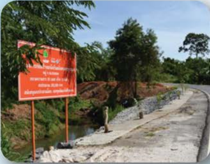
โครงการก่อสร้างผนังกันตลิ่งคลองทุ่งหลวง กองทุนพัฒนาไฟฟ้าชนอม