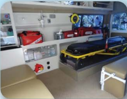
โครงการอุปกรณ์ช่วยชีวิต หนองสนม กองทุนพัฒนาไฟฟ้าเขตนิกม อุตสาหกรรมมาบตาพุด จังหวัดระยอง