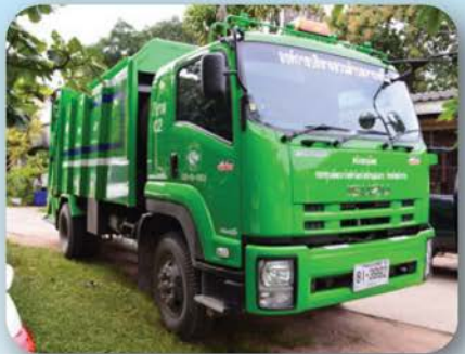
โครงการจัดซื้อรถบรรทุกขยะ กองทุนพัฒนาไฟฟ้าโรงไฟฟ้าแม่เมาะ จังหวัดลำปาง