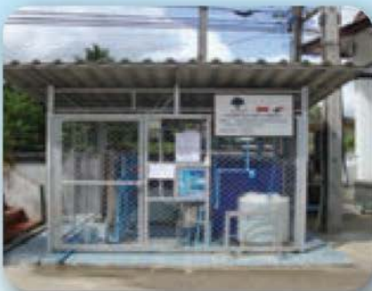
โครงการตู้หยอดเหรียญน้ำดื่มน้ำใช้ (บ้านสุเหว่า) กองทุนพัฒนาไฟฟ้าโรงไฟฟ้าจะนะ จังหวัดสงขลา