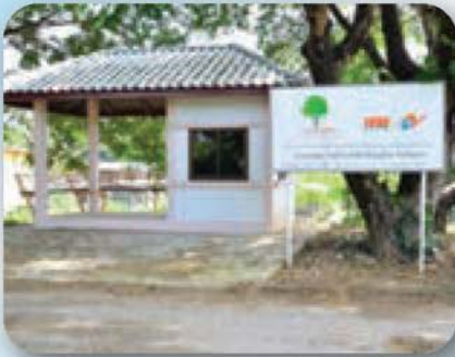
โครงการก่อสร้างบิโอมายมจุดเฝ้าระวัง แก้ไขปัญหาเสพติด กองทุนพัฒนาไฟฟ้าโรงไฟฟ้าเขื่อนภูมิพล จังหวัดตาก