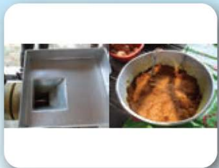
สนับสนุนกลุ่มเครื่องแกงบ้านทุ่งสาคร กองทุนพัฒนาไฟฟ้าโรงไฟฟ้ากระบี่