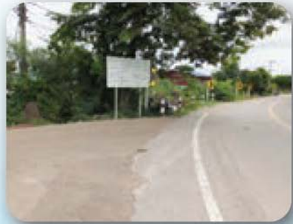
โครงการก่อสร้างถนน คสล. จำนวน 3 เส้น ตำบลพิบูลทอง กองทุนพัฒนาไฟฟ้าจังหวัดราชบุรี 1