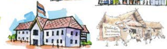
โครงการชุมชน