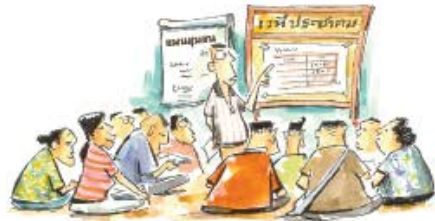
แผนชุมชน