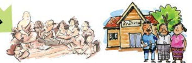
คณะกรรมการพัฒนาชุมชน/ตำบล