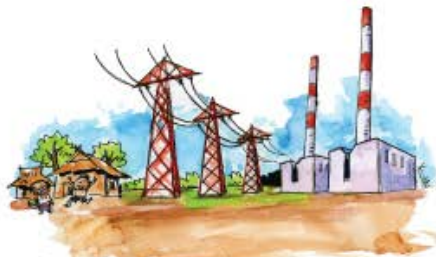
ลดผลกระทบ